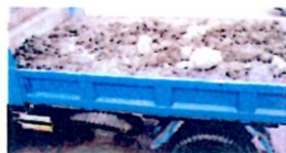
(トラックで運搬が可能)